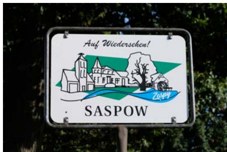
Zakazany język/ 14