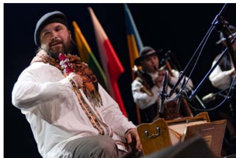
Nowa Tradycja? Nowa Tradycja!/ 12