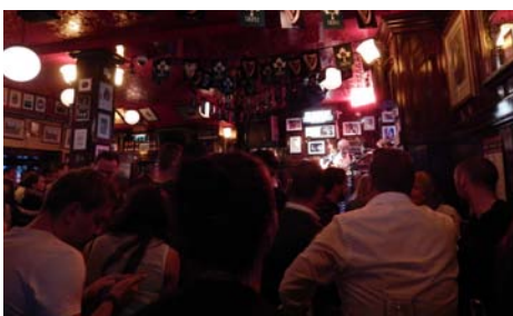
Między pubem, glenem a bogiem/ 33