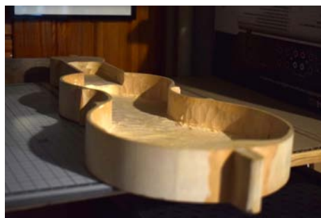
Kawałek drewna i to gra!/ 19